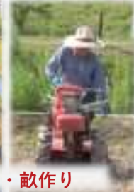
マルチ掛け・畝作り