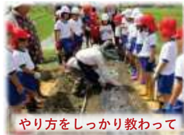
やり方をしっかり教わって