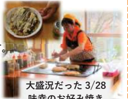
大盛況だった3/28 味幸のお好み焼き

送迎サービス:車の運転ができない等で来て頂く事が難しい方へ、送迎を致します。ご希望の方は、遠慮なく、「山の学校(75-7126)」までご連絡下さい。