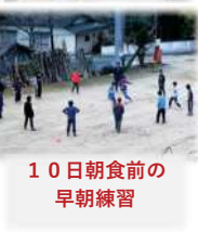
10日朝食前の 早朝練習